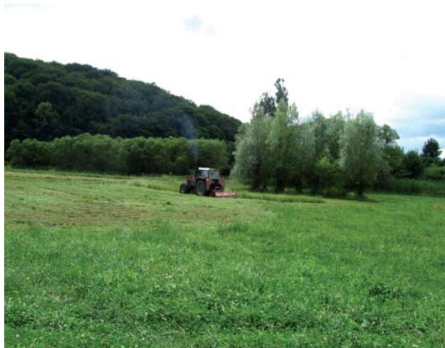
Kosenie v k.ú. Petrovce