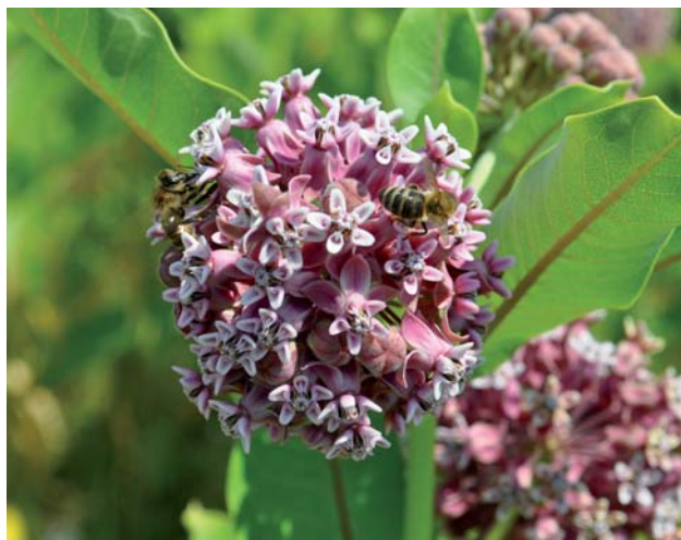
Súkvetie glejovky americkej

Na území CHKO Cerová vrchovina evidujeme výskyt napr. glejovky americkej / Asclepias syriaca , ktorá je druhom šíriacim sa z teplých južných častí Európy, pôvodom zo Severnej Ameriky, pričom na niektorých miestach sa už vyskytuje často vo veľkých populáciách (k. ú. Jestice). Kvitne od júna do júla, má špinavo