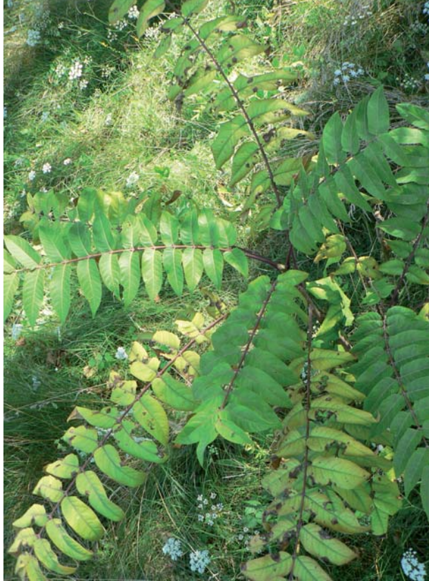
Pajaseň žliazkatý ( Ailanthus altissima )

Najčastejšími druhmi invázných drevín sú okrem agáta bieleho / Robinia pseudoacacia aj pajaseň žliazkatý / Ailanthus altissima a javorovec jaseňolistý / Negundo aceroides .