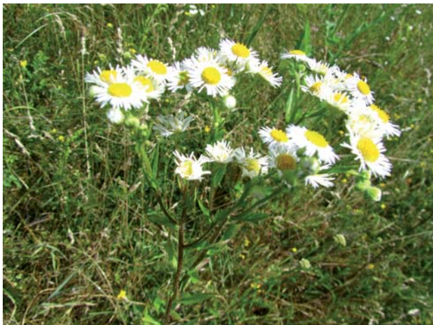
Hviezdnik ročný

Takmer zdomácnený druh hviezdnik ročný / Stenactis annua má často plošný výskyt predovšetkým na miestach opustených orných pôd, resp. úhorov i okrajov ciest. Takisto pochádza zo Severnej Ameriky. Kvitne v júli až októbri. Úbory tvoria súmerné okrajové kvety bielej alebo fialovkastej farby a pravidelné žlté kvety terča.