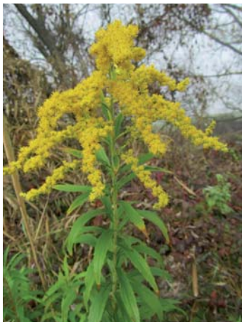
Najjednoduchším spôsobom odstraňovania zlatobyle je mechanicky (ostrihať alebo orezať súkvetia, prípadne kosiť plochy s rastlinami pred rozkvitnutím). Foto: Papáčová, L

Ďalšie druhy s častým výskytom v území sú 2 druhy zlatobyle / Solidago gigantea a S. canadensis . Zlatobyle majú striedavé na okraji zubaté listy, a ich súkvetia sú tvorené úbormi drobných žltých kvetov, usporiadaných do hustých chocholíkatých metlín. Kvitnú od konca augusta do septembra.