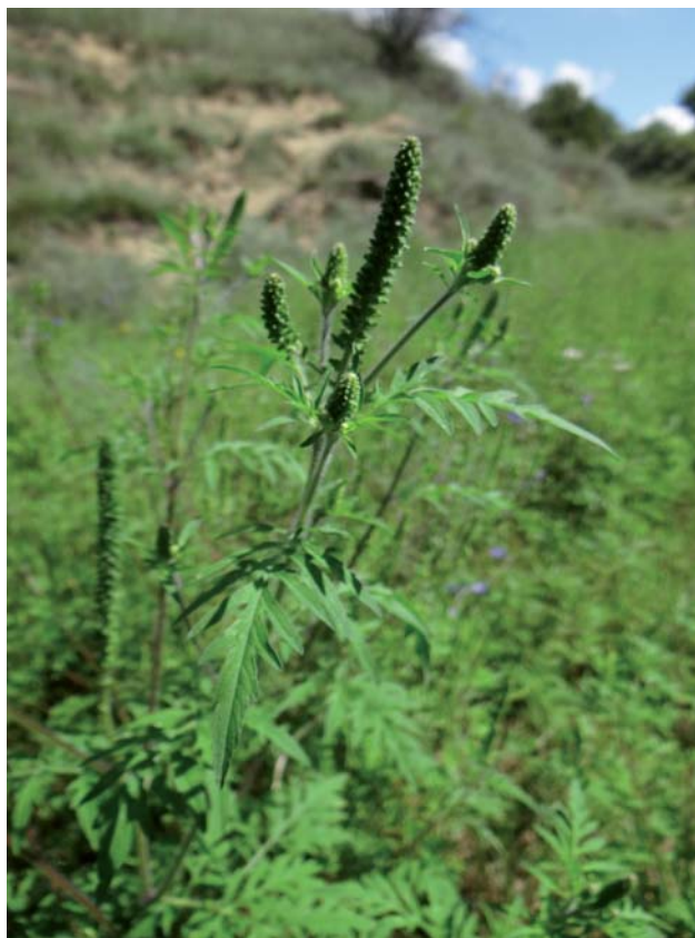
Ambrózia palinolistá v k.ú. Petrovce, foto: Belanová, E.

Na plochách navážok zeminy, okoliach ciest, úhoroch a eróziou narušených xerothermných pasienkoch sa vyskytuje aj ambrózia palinolistá / Ambrosia artemisiifolia . Ambrózia je pôvodom zo Severnej Ameriky. Listy má jednoducho až trikrát perovito strihané. Bledožlté kvety sú usporiadané v úboroch.