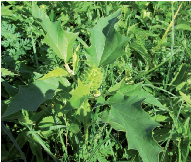
Plod durmana obyčajného

Najčastejšími druhmi invázných drevín sú okrem agáta bieleho / Robinia pseudoacacia aj pajaseň žliazkatý / Ailanthus altissima a javorovec jaseňolistý / Negundo aceroides .