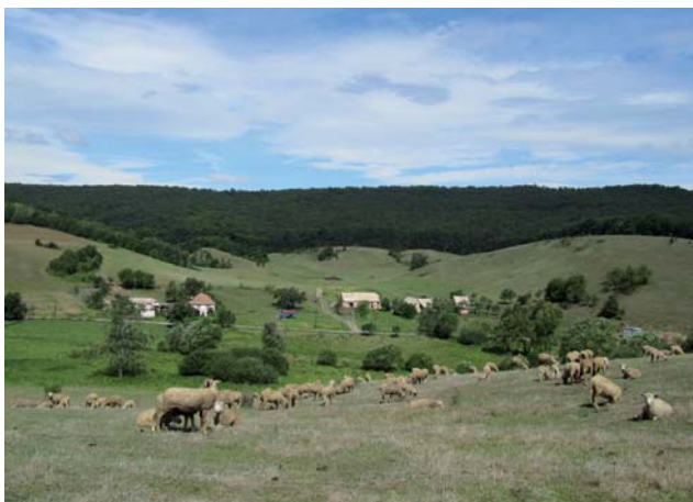
Tradičné obhospodarovanie v k.ú. Bizovo, foto: Papáčová, L.

Najvhodnejšou a aj neefektívnejšou formou predchádzania rozširovania invázných druhov rastlín, prípadne aj potláčania ich výskytu je obhospodarovanie pozemkov tradičnými spôsobmi, teda kosením a pasením . Z doterajších poznatkov vyplýva, že naopak mulčovanie trvalých trávnych porastov pravdepodobne významne napomáha k rozširovaniu niektorých druhov invázných rastlín na veľkých plochách.