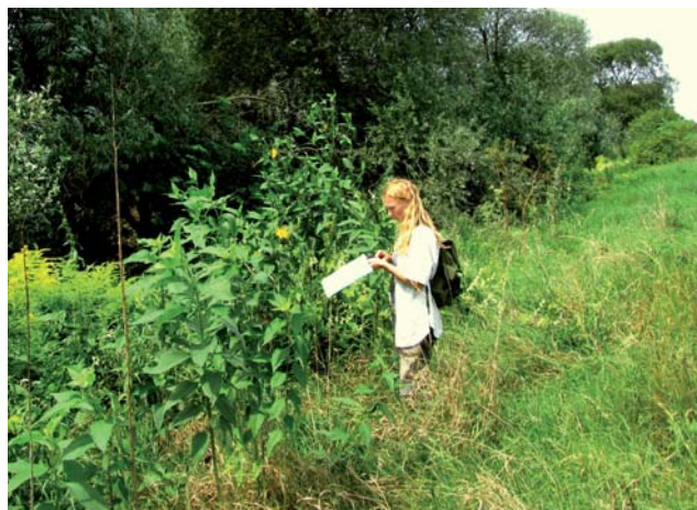
Mapovanie výskytu inváznych druhov rastlín

Na území Slovenskej republiky, ako aj na území CHKO Cerová vrchovina, prebieha priebežný monitoring výskytu týchto druhov, pričom okrem druhu je zaznamenávaná plocha jeho výskytu, fáza v ktorej sa rastlina nachádza (kvitnutie, tvorba plodov), prípadne spôsob využívania pozemku.