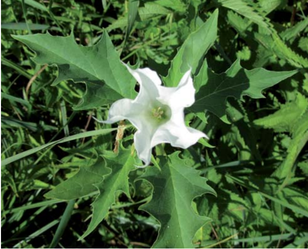
Kvet durmana obyčajného