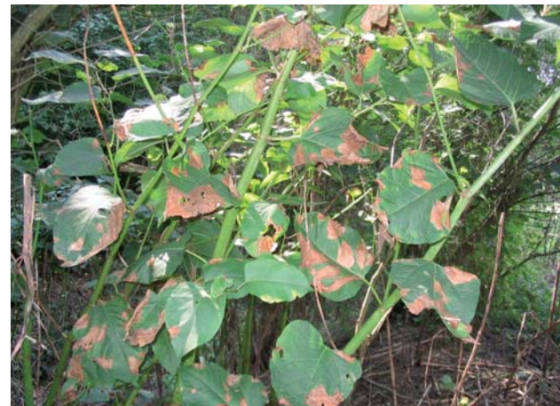
Pohánkovec po chemickom zásahu, lokalita Mačací potok, r. 2005

V CHKO sú lokalizované aj plochy s výskytom pohánkovca / Fallopia sp. Pohánkovec má pôvod vo východnej Ázii. Vyskytuje sa vo forme krovitých porastov, ktoré sú veľmi husté až nepreniknuteľné. Veľmi rýchlo a agresívne sa rozmnožuje podzemkami alebo ich fragmentami. Pri zemných prácach môže dochádzať k ich prenosu na nové lokality.