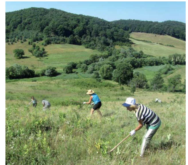
Mechanický spôsob odstraňovania glejovky americkej, sekaním

Odstraňovanie invázných druhov je najefektívnejšie v počiatočnej fáze ich výskytu, keďže v neskoršom období sa zvyšujú náklady na ich elimináciu. Z hospodárskeho hľadiska sa invázne druhy podieľajú na stratách úrody, prípadne znižujú plochy využiteľné pre hospodárenie. Môžu tiež spôsobovať ochorenia poľnohospodárskych plodín i hospodárskych zvierat. Niektoré druhy sú evidované ako alergény (ambrózia, zlatobyľ), alebo môžu spôsobovať popálenia kože (boľševník).