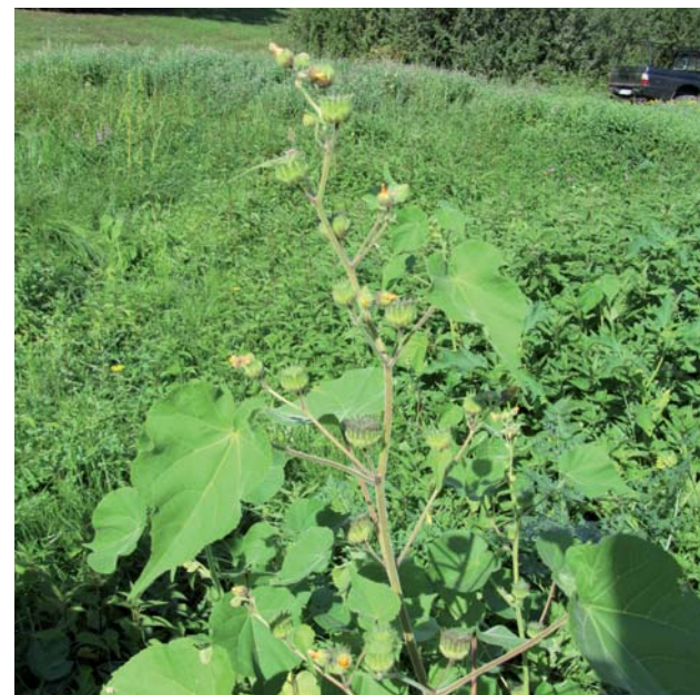
Podslnečník theofrastov

Voľné krmoviská poľovnej zveri sú častým zdrojom šírenia invázných druhov: durman obyčajný / Datura stramonium , podslnečník theofrastov / Abutilon theophrasti , sľnečnica hl'uznatá / Helianthus tuberosus .