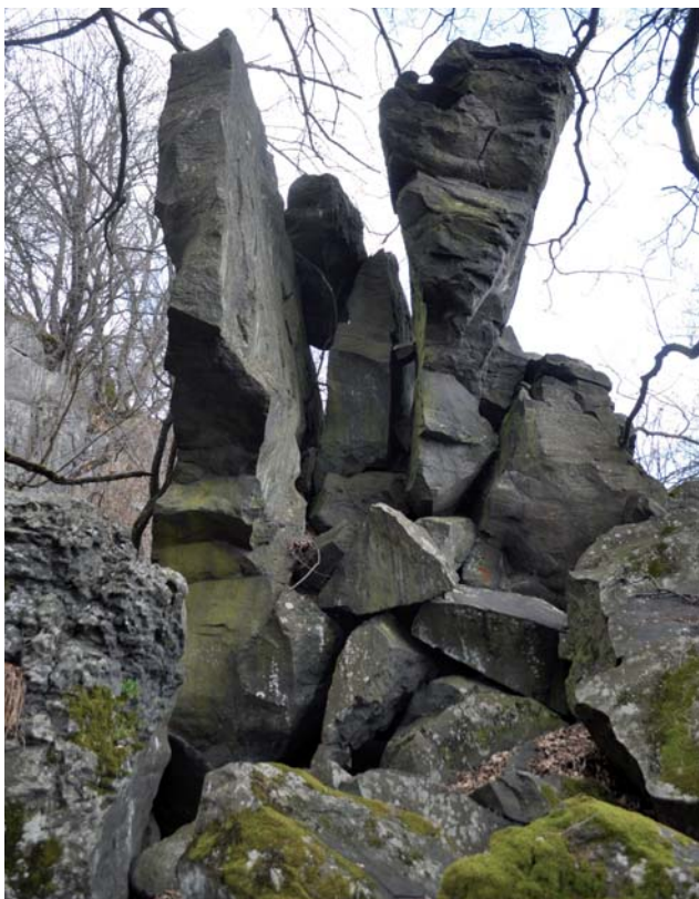
Dvojitá skala, NPR Pohanský hrad

NPR Ragáč (k. ú. Hajnáčka, V. stupeň ochrany) – najmenšia národná prírodná rezervácia v CHKO s výmerou 9,3 ha. Vrcholové časti tvorené troskovým kuželom sú predmetom ochrany od roku 1964. Zachovali sa v ňom dutiny po výbuchoch a výfukoch sopečných plynov a pár. Vek tohto vulkánu je 1,39 mil. rokov.