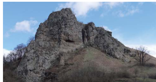
PP Soví hrad

CHA Fenek (k. ú. Petrovce, IV. stupeň ochrany) – chránený areál s výmerou 3,98 ha, chránený od roku 1993. Predstavuje ojedinelý zachovalý močiarny biotop v Cerovej vrchovine s výskytom kriticky ohrozených druhov rastlín, vzácnych druhov slimákov a hmyzu viazaného na vodu. Zamokrená eróznodenudačná dolina, je významným ekostabilizačným prvkom v krajine.