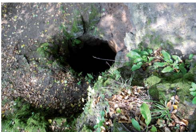
Studňa na Ragáci, NPR Ragáč

Za zmienku stojí aj pohraničná zelená turistická trasa ktorá z časti prechádza hranicou CHKO. V pohraničnom úseku prechádza aj Turistický náučný chodník Novohrad-Nógrád geoparkom, ktorého vybudovanie zabezpečila Oblastná organizácia cestovného ruchu Turistický Novohrad a Podpolanie.