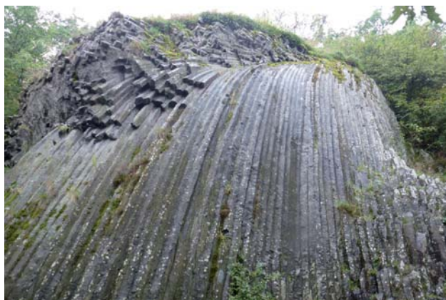
Kamenný vodopád, NPR Šomoška

Náučná lokalita Lipovianske pieskovce sa nachádza asi 600 m od obce, ku ktorej vedie nástupná trasa z obce. Na odkrytej pieskovcovej stene je možné študovať dva typy usadenín. Čakanovské vrstvy a lipovianske pieskovce v spodnej tretine profilu. Prílivové a odlivové prúdy plytkého príbrežného mora, v prostredí ktorého lipovianske vrstvy vznikali, spôsobili rôzne typy zvrstvení. V spodnej časti profilu sa nachádzajú spevnené skameneliny ulitníkov a lastúrnikov. Typickým prvkom pre toto súvrstvie sú sférické konkrécie (bochníky alebo gule), ktoré vystupujú z profilu. Táto náučná lokalita slúži najmä na výuku geológie.