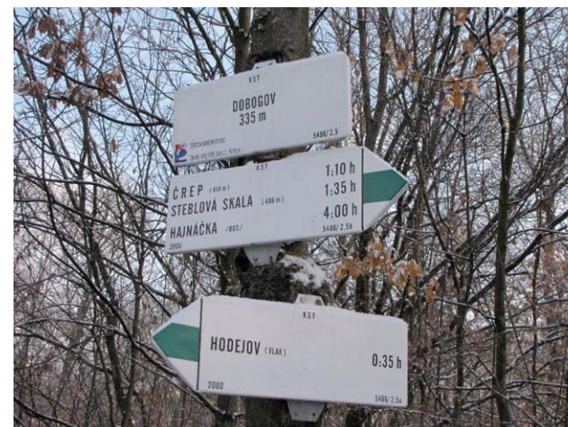
Turistický smerovník, Belinská skala a Dobogov