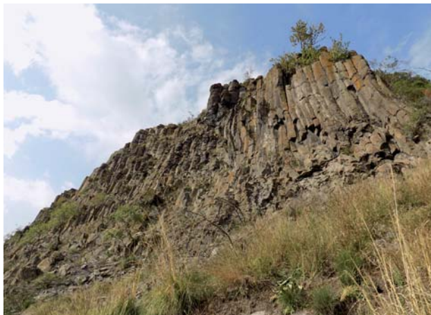
PR Steblová skala

NPR Pohanský hrad (k. ú. Hajnáčka, Stará Bašta, Šurice, V. stupeň ochrany) – národná prírodná rezervácia s výmerou 223,35 ha. Prvýkrát bola vyhlásená v roku 1964. Ochrana sa zameriava na rozrušený bazaltový okraj lávového pokrovu. Vytvorené sú v ňom jedinečné formy reliéfu – skalné veže, okná, skalná ulica. Z uvoľnených kamenných blokov pod bralami vznikli balvanové prúdy, v ktorých sa nachádza 31 pseudokrasových jaskýň. V súčasnosti je v celej CHKO evidovaných 42 pseudokrasových jaskýň.