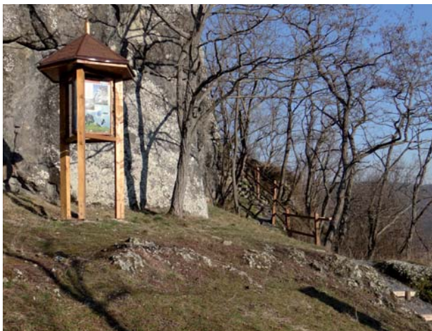
Infopanel, PR Hajnáčsky hradný vrch

Náučný chodník Šomoška prechádza Národnou prírodnou rezerváciou Šomoška, ktorá sa nachádza v k. ú. Šiatorská Bukovinka, priamo na hranici s Maďarskou republikou. Má dĺžku 1 600 m. Chodník, ktorý prechádza najstaršou rezerváciou CHKO (vyhlásená už v roku 1954) na svojich 6-tich zastávkach formou panelov oboznamuje návštevníka s rastlinstvom a živočíštvom, ktoré v rezervácii žije, s anorganickými útvarmi, známym kamenným vodopádom, ale aj kamenným morom pod hradom, s hradnou históriou, ako aj históriou umeleckých vodných nádrží na chodníku. Príjemná je aj prechádzka po chodníku v 200 ročnom bukovom lese na hradnom kopci. Chodník nie je náročný, a preto je s obľubou využívaný turistami všetkých vekových skupín. Na lúke, pred vstupom na chodník, je vybudovaný športovo-oddychový areál.