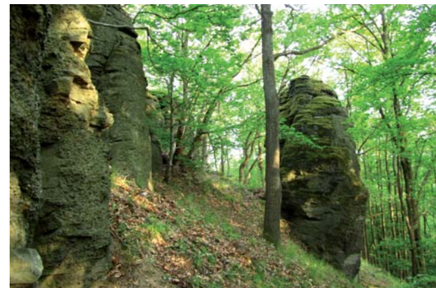
PP Belinské skaly

PP Belinské skaly (k. ú. Belina, V. stupeň ochrany) – prírodná pamiatka s výmerou 7,11 ha, vyhlásená od roku 1993. Repräsentuje ukážku tzv. skalného mesta v počiatočnom štádiu vývoja. V dôsledku zvetrávania bazaltu vznikajú skalné veže, okná a výrazné doskovité formy odľučnosti.